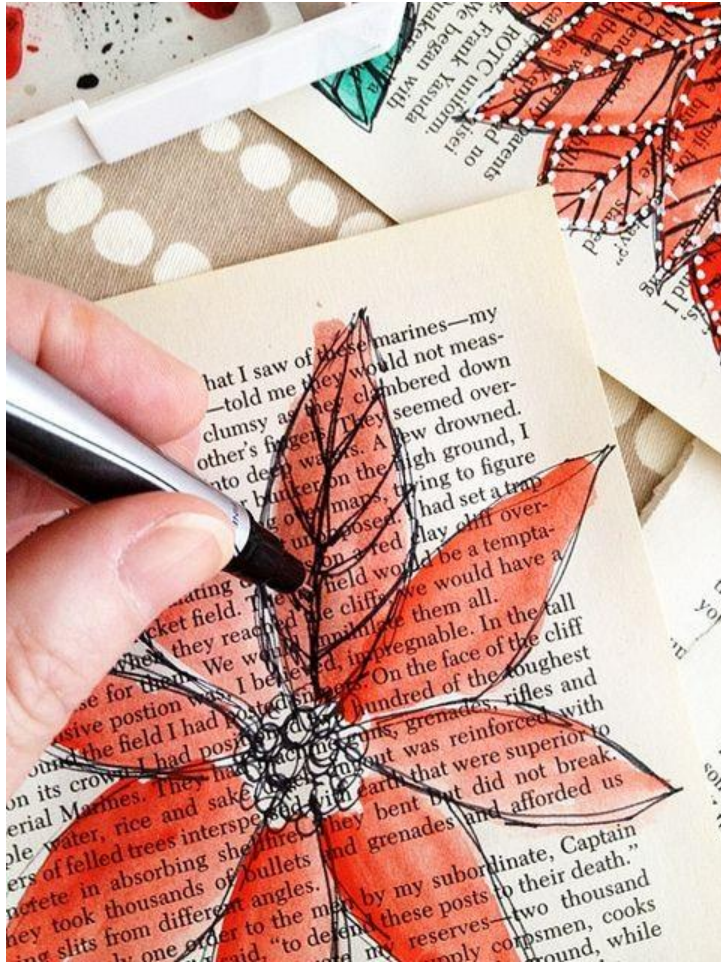
Obojajte latice cvijeća, detalje možete naglasiti tankim linijama s flomasterom